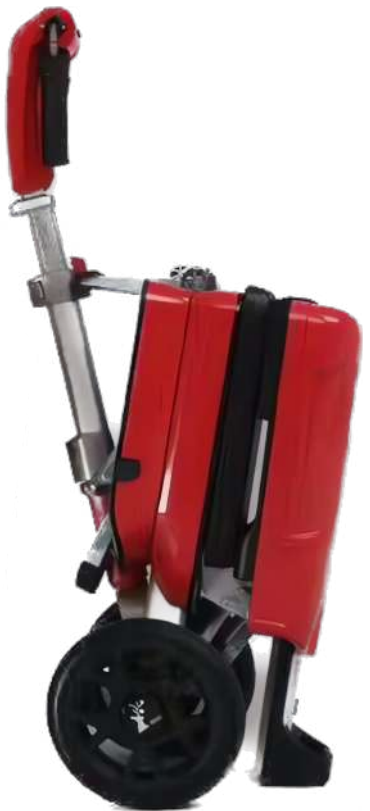
largura dobrada 40 cm

O seu tamanho pequeno permite o fácil armazenamento e transporte, da scooter. A Scooter Esla (M) é a escolha ideal para quem procura uma forma cômoda e eficiente para se deslocar.