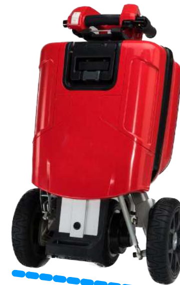
largura dobrado 43cm