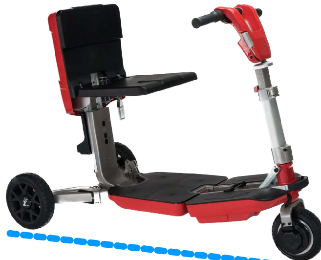
largura desdobrada 125 cm