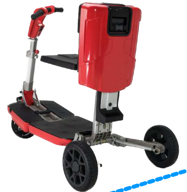
largura desdobrada 58.5cm